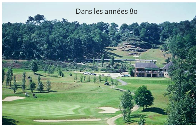
Dans les années 80

Indépendamment du niveau de jeu, bien jouer ou ramener un bon score restent les objectifs premiers de tous les golfeurs. La réalité est souvent autre et chaque joueur doit être prêt à l'admettre. Jouez toujours en ayant un comportement respectueux : sans plainte envers d'autres joueurs, sans maltraiter le matériel ou le parcours. En définitive, ce n'est pas votre score que vos partenaires garderont en mémoire mais votre attitude sur le terrain et au club house.