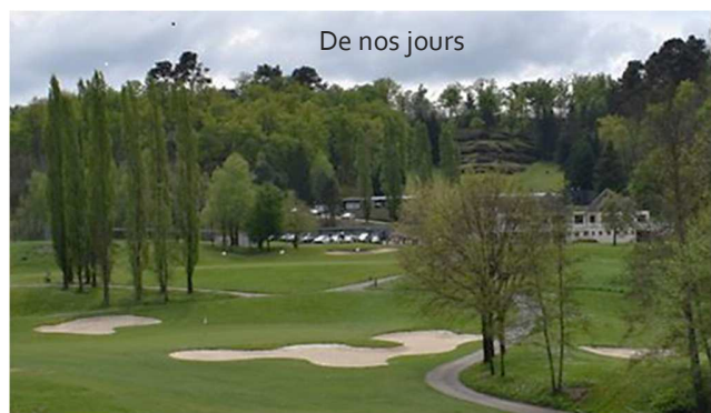
De nos jours